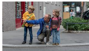
Regelmäßiges, gemeinsames Training ist wichtig!

Gehen Sie mit Ihrem Kind den Schulweg ab und erklären Sie ihm, warum es wo gefährlich ist und worauf es als Fußgängerin bzw. Fußgänger achten muss. Üben Sie problematische Stellen (siehe Schulwegplan) besonders gut. Beim nächsten Mal lassen Sie sich bereits von Ihrem Kind führen, das dabei über sein Verhalten spricht. So können Sie feststellen, ob es alles richtig verstanden hat und eventuell korrigierend eingreifen.