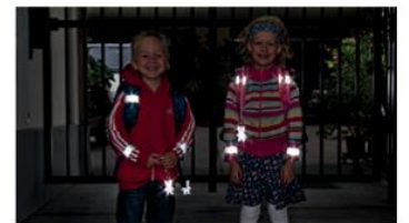
Sicherheit durch Sichtbarkeit!

Sorgen Sie dafür, dass Ihr Kind im Straßenverkehr rechtzeitig gesehen wird. Gerade im Herbst und Winter, wenn es in der Früh noch dunkel ist oder bei nebligem Wetter ist helle Kleidung von Vorteil. Noch besser wirken Reflektoren an Kleidung und Schultaschen – mit diesen können Kinder von Autofahrerinnen und -fahrern schon aus einer Entfernung von 130 Metern wahrgenommen werden.